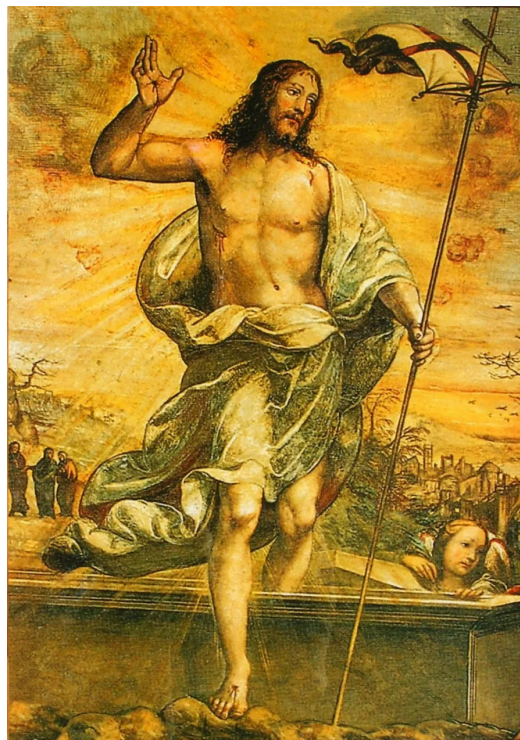
Zmartwychwstanie, Giovanni Antonio Bazzi, 1477 – 1549

„Wieczorem owego pierwszego dnia tygodnia, tam gdzie przebywali uczniowie, choć drzwi były zamknięte z obawy przed Żydami, przyszedł Jezus, stanął pośrodku i rzekł do nich: «Pokój wam!» A to powiedziawszy, pokazał im ręce i bok. Uradowali się zatem uczniowie, ujrawszy Pana. A Jezus znowu rzekł do nich: «Pokój wam! Jak Ojciec Mnie posłał, tak i Ja was posyłam»” (J 20,19-20).